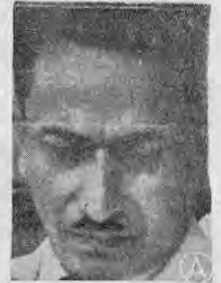
CASTILLO ARMAS ...fue puesto en libertad uno de los acusados...

Sigue en el misterio muerte de Castillo Armas