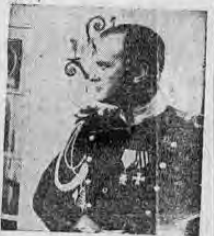
El último vals

6.30 y 8.30 ..... € 2.00 La exquisita joya romántica que canta en los corazones! Curt JURGENS, Eva BARTOK