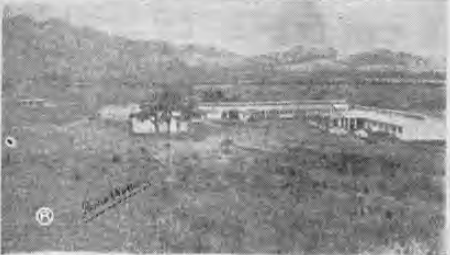
Súplicas, amarguras, horas de esfuerzo llevado a lo superlativo, desprendimiento de gentes generosas, sueños e ilusiones cuajados en realidad: AQUÍ ESTA LA CIUDAD DE LOS NIÑOS.