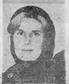
Duquesa de Alba y Berwick

Cuando se le pregunta a los aldeanos que cultivan las extensas tierras de la Duquesa cuántos castillos posee su ama, ellos contestan: Pues... suficientes como para que pueda visitar uno diferente, cada semana del año".