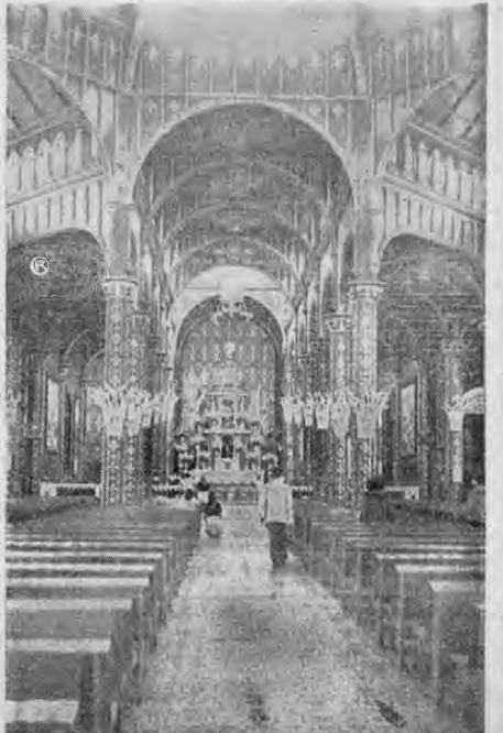
Vista del interior de la Basílica de Nuestra Señora de los Angeles, en la ciudad de Cartago, donde se efectuaron hoy los ritmos actos religiosos en honor de la Patrona de Costa Rica.