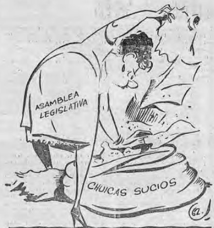
pero la verdad es que no hay "tanda de 3" que lo supere y además, gratis!...

El anciano es ayer. El adulto, mañana. El niño, hoy. Un hoyo con urgencias inaplazables. ¡A solucionar esas urgencias...! Todos al Campo Ayala los días 2, 3, 4 y cinco de Agosto.