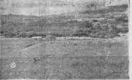
Así se veía, hasta hace poco tiempo el lugar en donde hoy se yergue, como un ejemplo de buena voluntad y de esfuerzo, LA CIUDAD DE LOS NIÑOS.